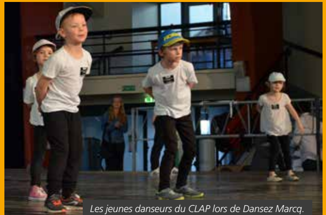
Les jeunes danseurs du CLAP lors de Dansez Marcq,

Pour les plus jeunes, le CLAP (Culture Loisirs Action Plouich) propose des cours de danse, d'éveil musical ou encore d'arts plastiques. Les plus grands et les adultes peuvent, auprès du FCP (Club Formation Culture Prévention), avoir une oreille attentive lors du café des habitants ou participer à diverses actions dans le quartier.